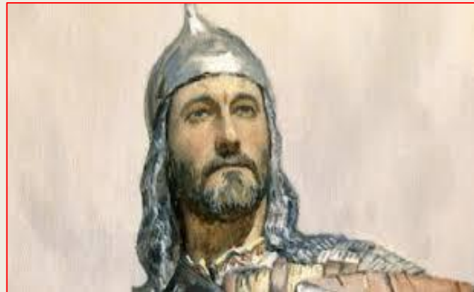
Дмитрий Иванович Донской

Усиление Московского княжества встревожило Мамая. В 1378 году он послал на Русь сильное войско под командованием мурзы Бегича. Войско князя Московского Дмитрия Ивановича встретило ордынцев на реке Воже и наголову разбило их.