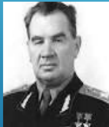
Главнокомандующий Сухопутными войсками, заместитель Министра обороны СССР В.И. Чуйков