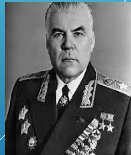
Маршал Советского Союза Р. Я. Малиновский