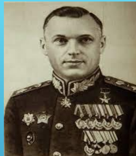
Маршал Советского Союза К.К. Рокоссовский

6-й армией вермахта командовал фельдмаршал Паулюс. 4-й танковой армией — генерал Гот. 8-й итальянской армией — генерал Гарибольди. 2-й венгерской армией — генерал Яни, 3-й и 4-й румынскими армиями — Думитреску и Константинеску соответственно. Хорватским 369-м полком командовал полковник Павичич.