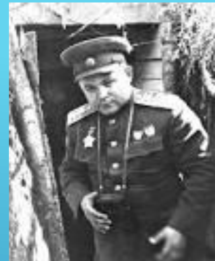
Генерал армии Н.Ф. Ватутин